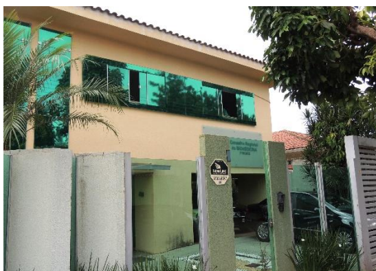
(Seccional de Goiânia – GO)

O Conselho Regional de Biomedicina da 3ª Região (CRBM-3) é uma autarquia federal com jurisdição nos estados de Goiás, Tocantins, Mato Grosso, Minas Gerais e no Distrito Federal. Tem autonomia administrativa e financeira.